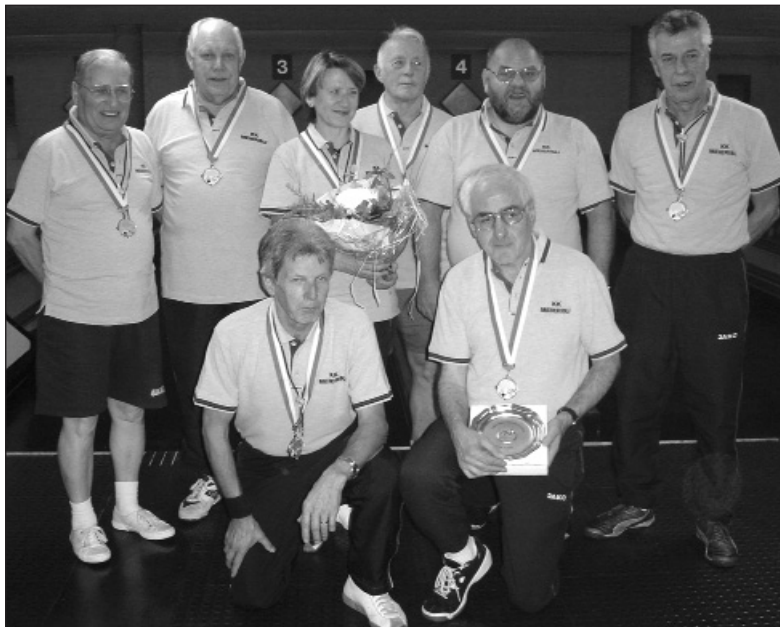
Die Zweitplatzierten in der Kat. B: KK Meierisli, Zürich