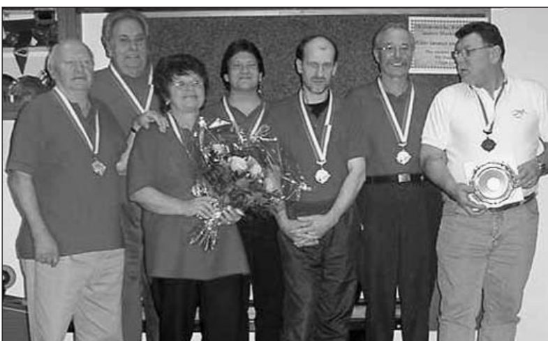
Die Zweitplatzierten in der Kat. C: KK Hagebächli, Schweizerhalle