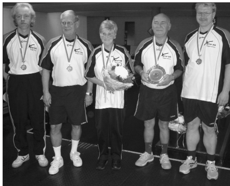
Die Drittplatzierten in der Kat. B: KK Leu, Wigoltingen