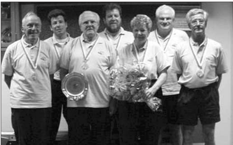
Die Sieger in der Kat. C: KK Voregg-Unterstrass, Zürich