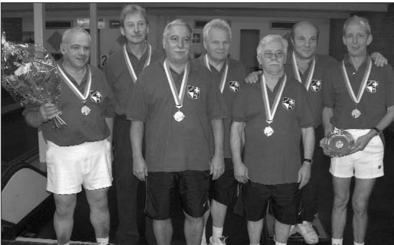
Die Zweitplatzierten in der Kat. A: KK Topego, Zürich