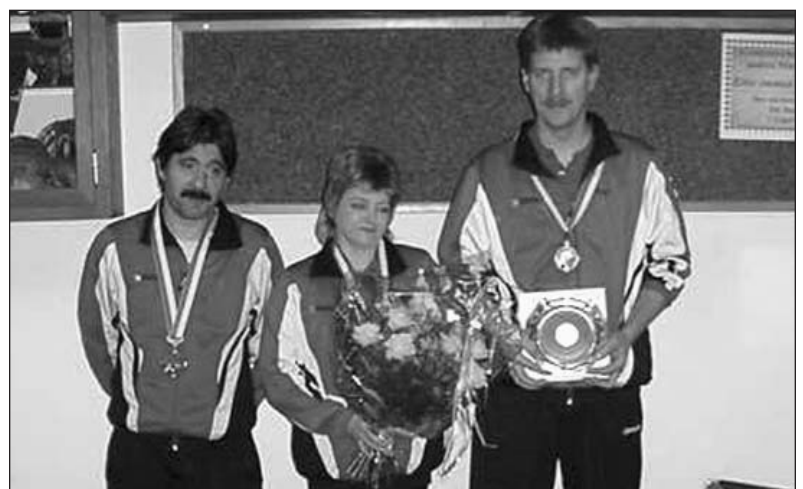
Die Drittplatzierten in der Kat. C: KK Traube, Langendorf