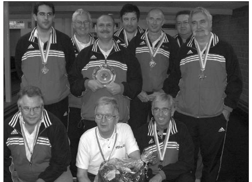
Die Drittplatzierten in der Kat. A: KK Fähre, Beckenried