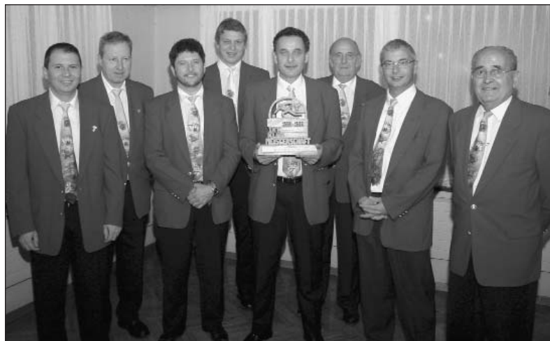
Sieger Kantonale Klub-MS: KK Seerose