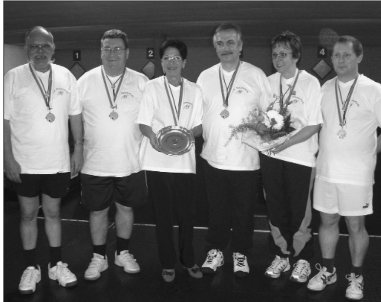
Die Sieger in der Kat. B: KK Schwyzerhüsli, Otelfingen