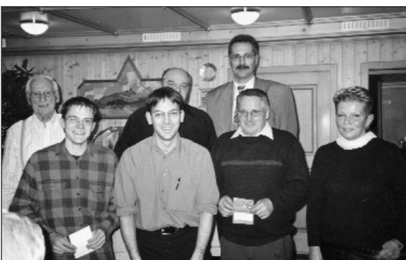
Kant. Einzelcup: alle die die erste Runde überstanden