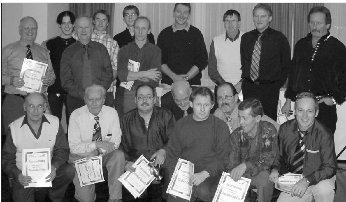
Die ersten Drei aller Kategorien der Wallisermeisterschaft 2004