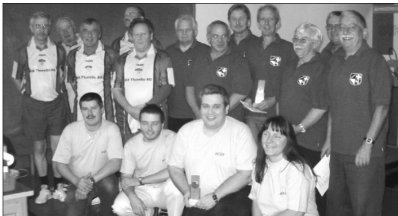
Die ersten Drei der Region 3, Kategorie A.

Der Bericht der Region 2 war bis zum Redaktionsschluss nicht vorhanden und erscheint deshalb mit Fotos in der nächsten Ausgabe Nr. 18 vom 16. November 2006