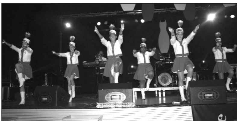
Die Majoretten aus Zürich bei ihrem Auftritt.