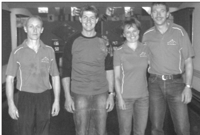
Sieger der Region 1, Kategorie C, KK Täschhorn, Täsch