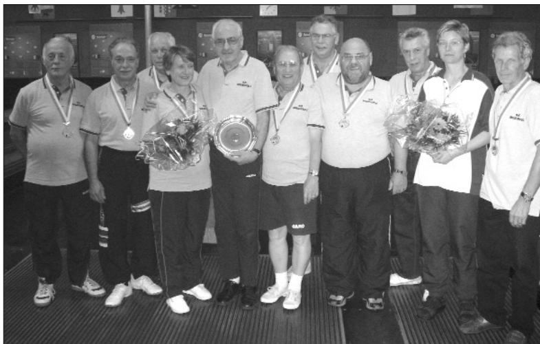
Schweizer Klubmeister Kategorie B: KK Meierisli, Zürich

Resultat von 737.2 Holz vorgelegt. Daran kamen alle Nachfolgenden nie heran und die Zürcher konnten somit ihren Sieg von 2004 ebenfalls wiederholen. Der KK Reuss aus Altdorf sicherte sich die Silbermedaille vor KK Eschenholz aus Eschenbach.