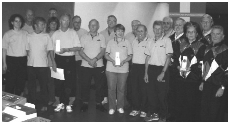
Die ersten Drei der Region 3, der Kategorie B