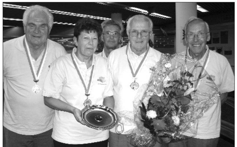
Schweizer Klubmeister Kategorie C: KK Voregg-Unterstrass Zürich