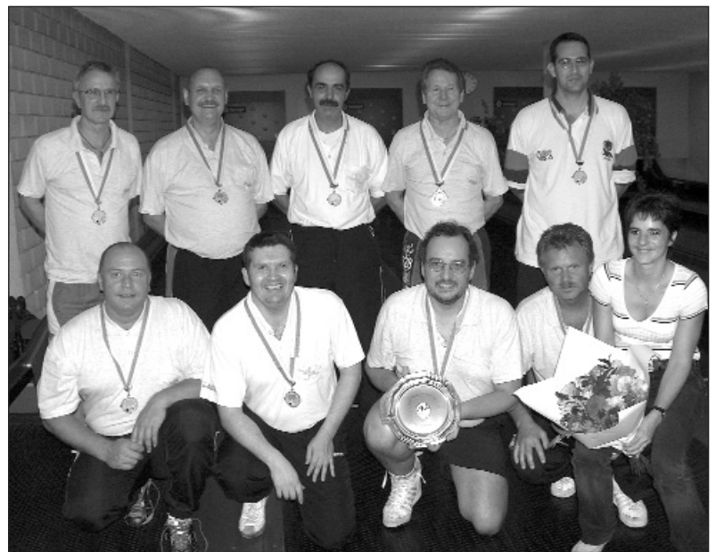
Schweizer Klubmeister Kategorie A: KK Daniel Bern.

Im Final der Kategorie B, ausgetragen in Luzern, setzten die Einheimischen vom KK Fortuna mit 808.4 Holz eine erste gute Marke. Man wusste zwar zu diesem Zeitpunkt nicht, was das Wert war, aber als Klub um Klub deutlich daran scheiterte begann man zu glauben, dass hier mindestens eine Medaille in der Luft lag. Als drittletzter Klub starteten am Sonntag die Zürcher Favoriten vom KK Meierisli. Mit 821.6 Holz Durchschnitt verwiesen sie die Einheimischen vom KK