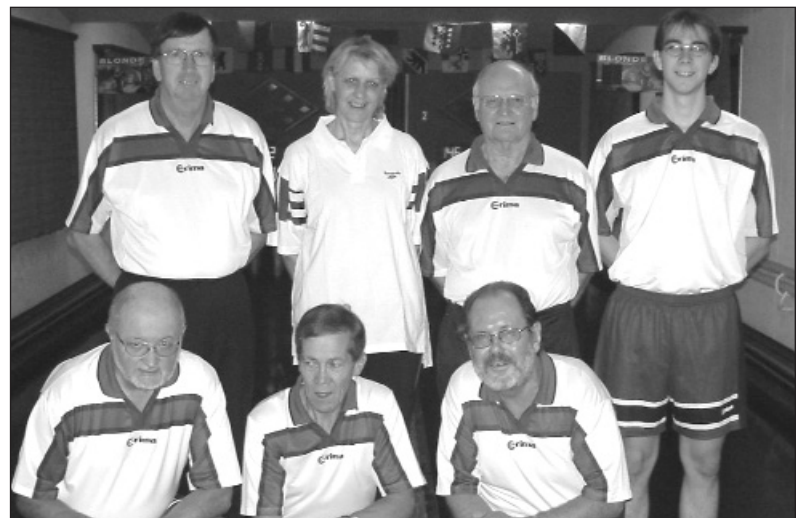
Sieger der Region 1, Kategorie B, KK Aletsch, Naters