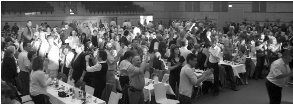
Ein begeistertes Publikum. Es wurde sogar auf den Tischen getanzt.