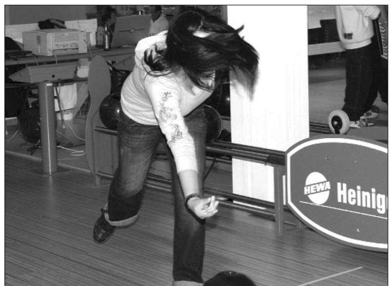
Eine unbekannte Schülerin bei der Kugelabgabe. Irgendwas ist hier falsch.