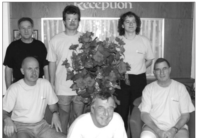
Die Sieger des 5-Ständewettkampfs, UV Thurgau