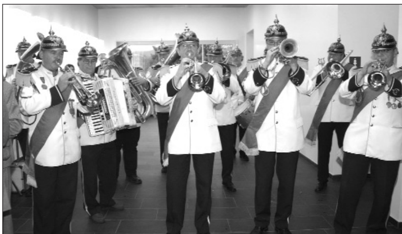
Die Tätschappemusig machte den Auftakt zur Jubiläumsfeier.