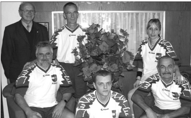
Die Zweitplatzierten und Gastgeber, UV Aargau