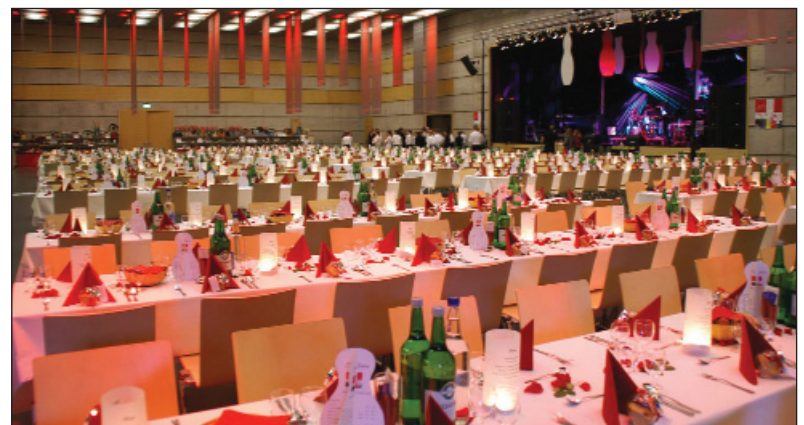
Der durch die Belvoirparkschule festlich geschmückte Saal in der Stadthalle Dietikon am Samstag vor dem grossen Fest.

Ein derartiger grosser Anlass braucht eine grosse Menge Vorarbeit. Es müssen die richtigen Kontakte geknüpft werden und die