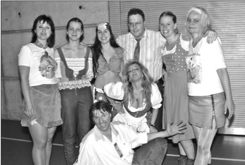
Autogrammjäger Speedy umrahmt von den Hiattamadl und Gunta.

künsten die wiederum leider spärlich anwesenden Gäste begeisterte. Aus Mangel an Teilnehmern musste das Familienkegeln und das Kinderclub-Kegeln abgesagt werden. Trotzdem liefen die Kegelbahnen nochmals auf Hochtouren. Viele nutzten die