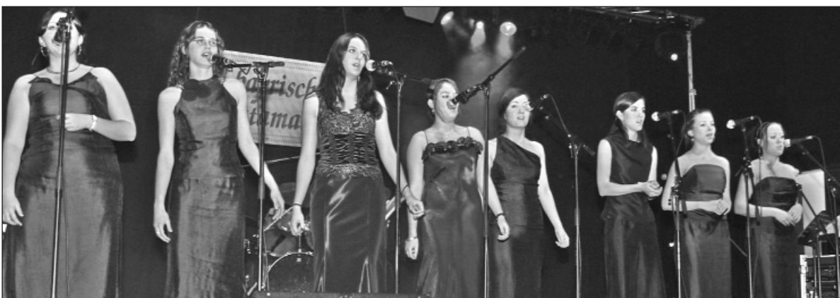
Die jungen Krambambulis bei ihrem Auftritt am Freitag sorgten für besinnliche Momente.

Neuorientierung. Oberstes Ziel ist es nun, den Schwung auszunützen und mit voller Energie alles daran zu setzen, dass der SSKV eine Zukunft hat, sodass wir dann in 25 Jahren das 100-Jährige feiern zu können.