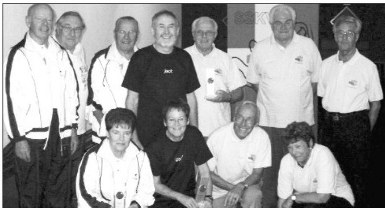
Die ersten Drei der Region 3, der Kategorie C