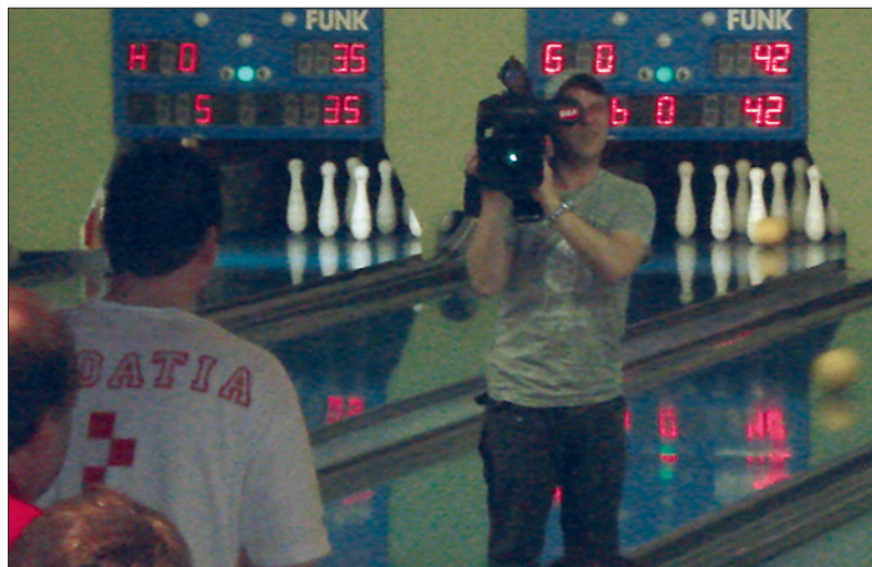
Ein Kameramann des ORF bei den Dreharbeiten.