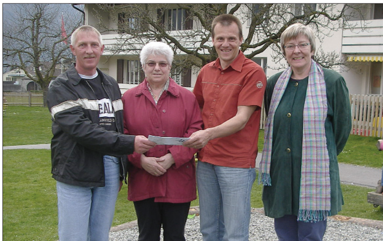
Vertreter des KK Kinzig bei der Übergabe des Spendengeldes an das Kinderheim Uri.