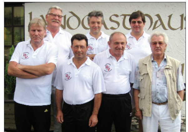
Viertplatzierter UV Basel-Stadt