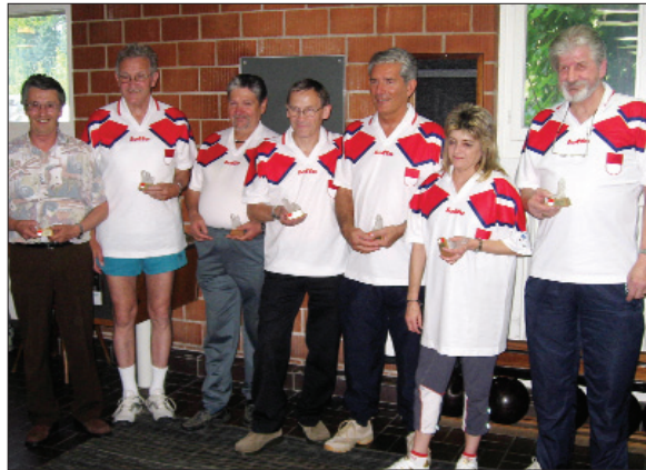
Sieger 4-Kantonwettkampf: UV Solothurn.

Der letztjährige Sieger, UV Basel-Land, möchte sicherlich diesen Sieg gerne wiederholen. Als letzte Mannschaft stiegen sie in das Wettkampfgeschehen ein. Alle waren gespannt, welcher Kanton wohl gewinnen werde, denn von Anfang bis Ende jagte ein Resultat das andere. Nach dem letzten Wurf wurde im Rechnungsbüro die Rang-