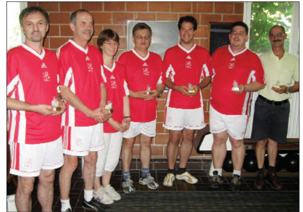
Zweitplatzierter UV Basel-Land