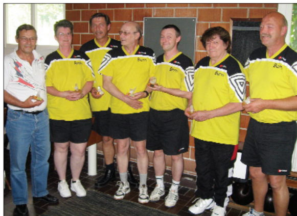
Drittplatzierter UV Bern