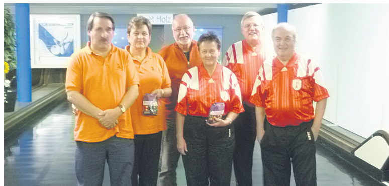
Die drittplatzierten Basel-Länder.