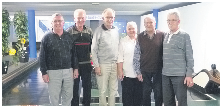
Die Neueinsteiger und viertplatzierten Luzerner.