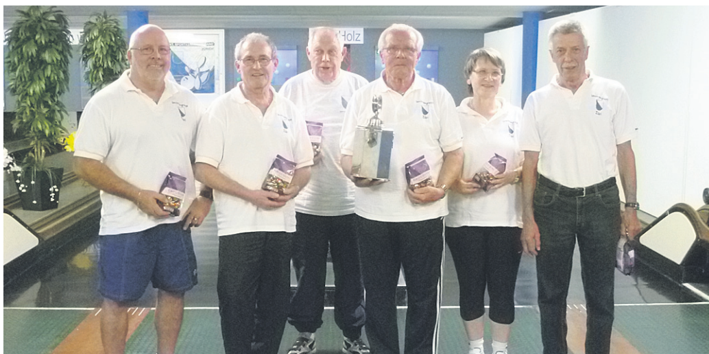
Die siegreiche Zürcher Mannschaft.