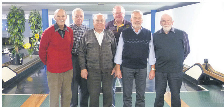
Die zweitplatzierten Berner.