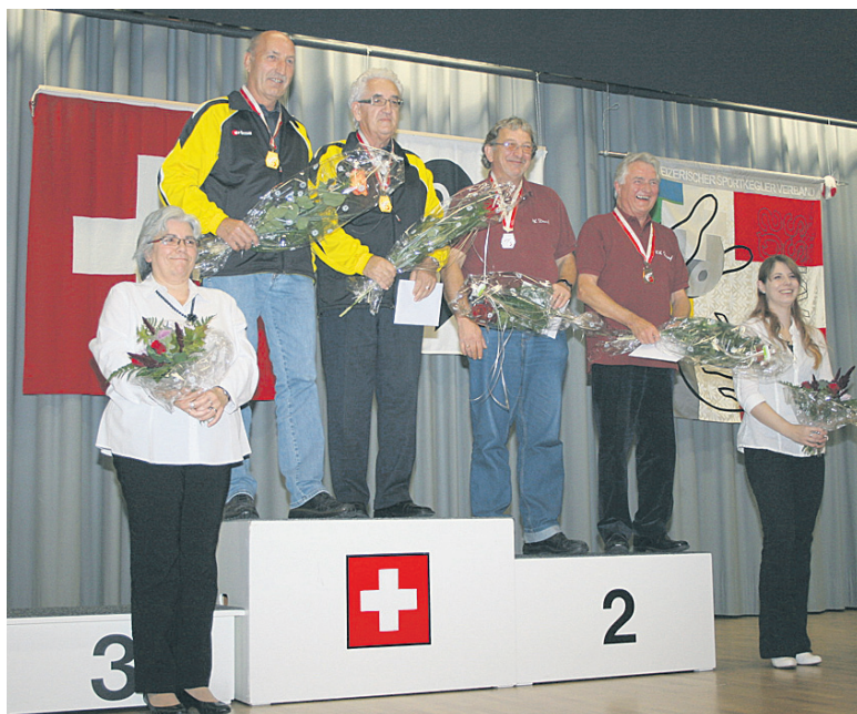
Américaine Kat. 3.