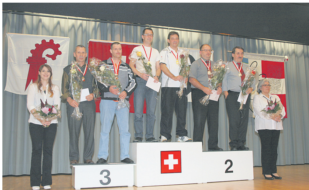
Américaine Kat. 1.