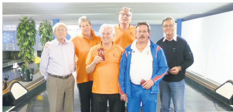
Diesmal nicht so viel Wettkampfglück, die fünftplatzierten Basel-Städter.