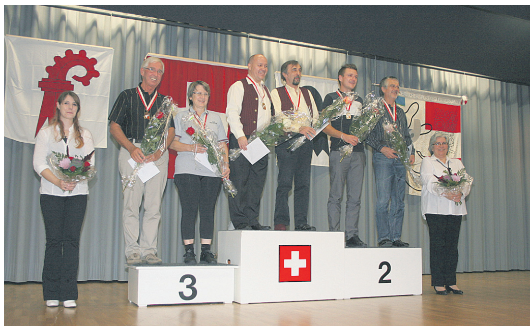
Américaine Kat. 2.